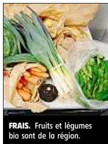
FRAIS. Fruits et légumes bio sont de la région.

Ceux qui veulent manger sain peuvent s'inscrire sur le site de l'association et s'abonner à l'une des trois formules mises à disposi-