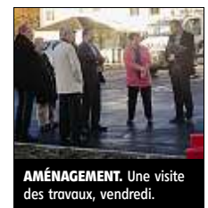
AMÉNAGEMENT. Une visite des travaux, vendredi.

Les anciens stationnements étaient trop proches des maisons et occasionnaient des désagréments sonores. Les gaz incommodes des habitants. Elles vont donc être remplacées par un espace vert. Des places de stationnement pour personnes handicapées ont été créées. La chaussée a été bétonnée et le réseau France Télécom a été enfoui. Reste les candélabres