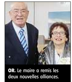
OR. Le maire a remis les deux nouvelles alliances.

Ils se sont rencontrés en août 1959 lors d'un bal, à Orléans. Cela a été le coup de foudre ! Ils se sont d'abord « testés » pendant deux ans et ont fini par se marier, le 10 juillet 1961. Ils sont tous deux très impliqués dans la vie de la commune, et ont de nombreuses activités. « Ce qui