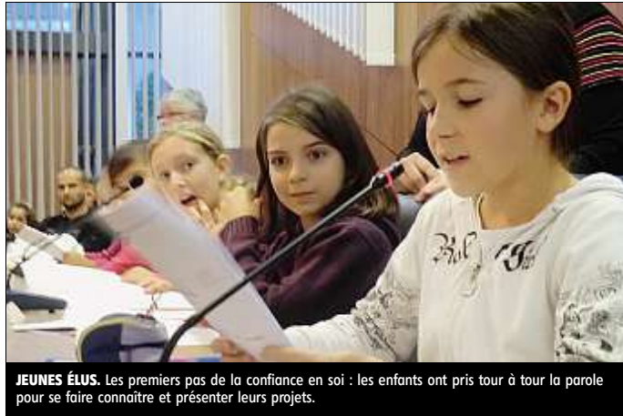
JEUNES ÉLUS. Les premiers pas de la confiance en soi : les enfants ont pris tour à tour la parole pour se faire connaître et présenter leurs projets.